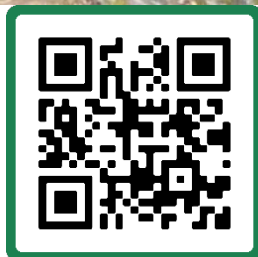
Çanakkale, July 2025