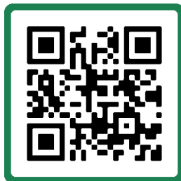
Canakkale, July 2025